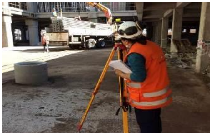
Control de nivel radier edificio UPC (post hormigonado)

Se mantiene la ejecución de controles y verificaciones de posicionamiento en planimetría y altimetría de los trabajos mediante el control de cotas (niveles), además de verificar mediante el uso de una estación total y nivel topográfico, los elementos verticales y horizontales levantados a la fecha.