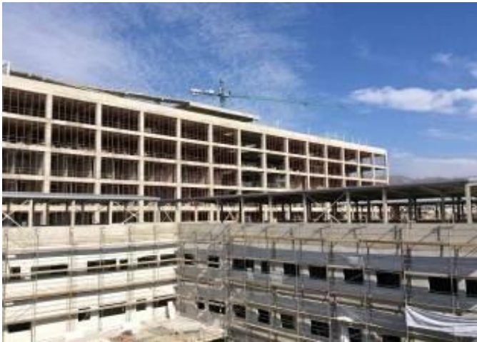
Avance en la colocación de hormigón en edificio Torre Hospitalización TH