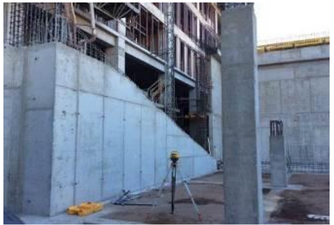
Armado y Hormigonado de muro y columnas de auditorio