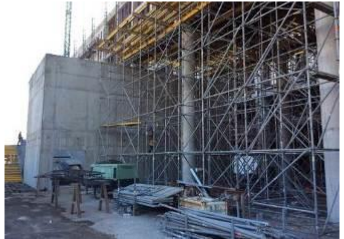
Último avance en el sector de auditorio