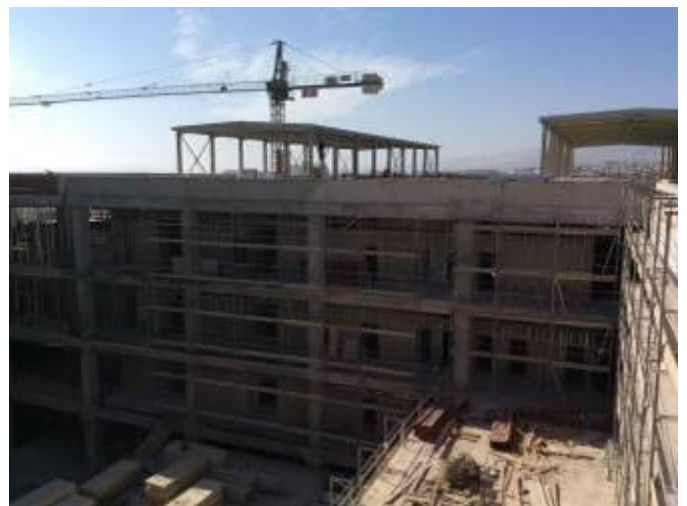
Avance en la colocación de hormigón en edificio CDT