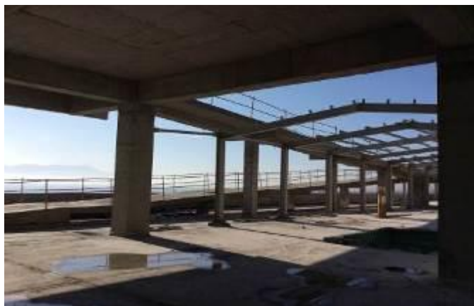
Rampa acceso a losa helipuerto