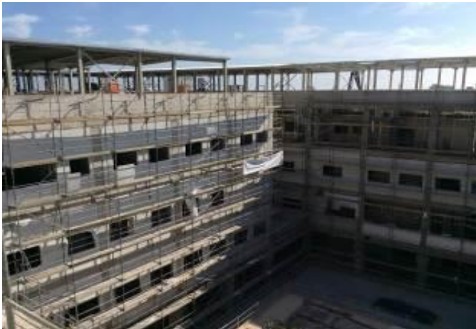
Avance en la colocación de hormigón en edificio Unidad de Pacientes Críticos UPC