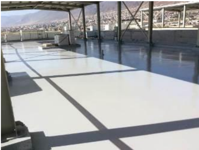
Avance pintura salas técnicas edificio CDT